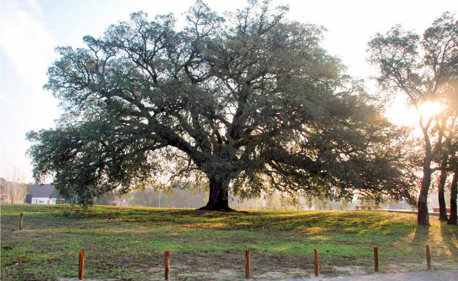
Candidat portugais - le plus grand chêne-liège au monde