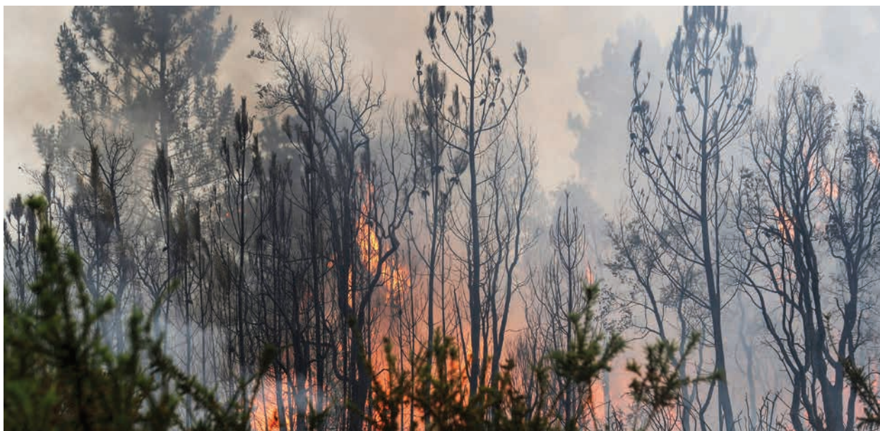
Les incendies de forêt dans le sud de l'Europe en 2017