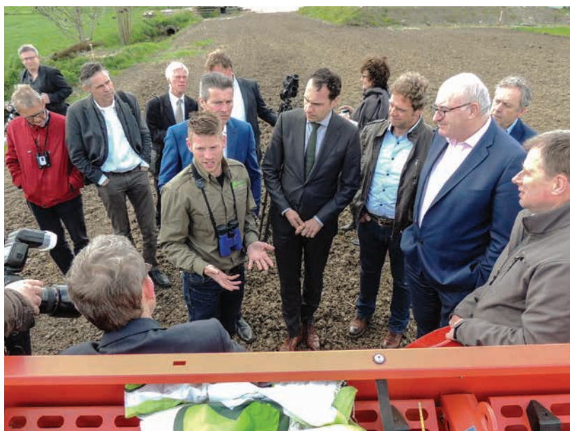
Phil HOGAN, Commissaire européen pour l'agriculture et Martijn van DAM, Sectétaire néerlandais aux affaires économiques, en visite sur le site de Oude Doorn; Pays-Bas, 2017.

Les mesures d'habitat les plus efficaces de PARTRIDGE sont l'introduction de divers mélanges de fleurs qui fournissent un habitat convenable tout au long de l'année, ainsi que des bandes d'herbes pour coléoptères (ang. beetle banks), des chaumes de