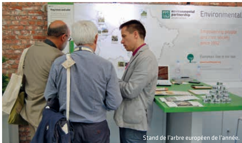
Stand de l'arbre européen de l'année.

La remise du prix 2015 de l'arbre de l'année,