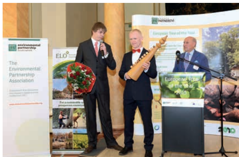
La délégation estonienne du Tree of the Year recevant son prix.

Le concours de l'arbre de l'année fut exposé parmi les autres activités de l'association comme étant l'évènement européen de l'année le plus important en ce qui concerne la préservation de notre capital naturel. Les visiteurs devaient essayer de deviner de quels pays venaient les différents arbres finalistes sur la carte de l'Europe, beaucoup parmi eux se sont pris au jeu et ont raconté leurs propres souvenirs liés à un arbre en particulier. La Green Week a aussi permis d'élargir la portée de l'évènement grâce à l'inscription de l'Allemagne et de la Lituanie pour le concours de l'année prochaine, rapprochant le concours d'une compétition se jouant au niveau pan-européen.